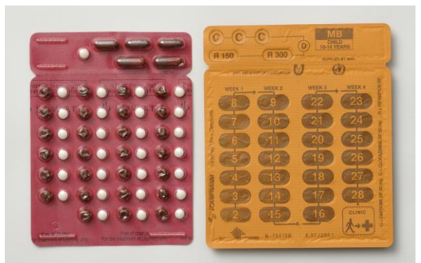
現在の治療法である多剤併用治療法 (MDT) で使用する薬