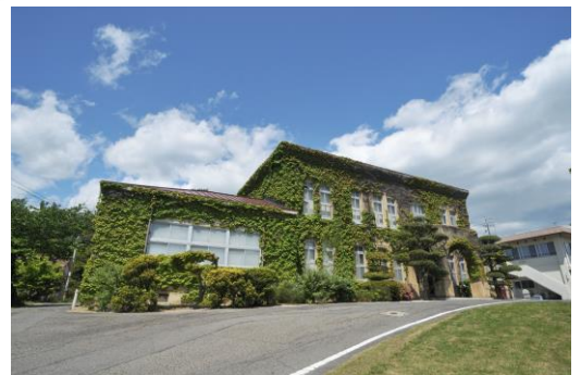
長島愛生園歴史館

長島愛生園は、 県 市にある、国立の療養所で、 (昭和 ) 年に発足しました。当時、感染症である 病に有効な治療薬がなく、国は、患者を療養所に強制的に する政策を取りました。1946 (昭和21) 年頃から特効薬を使用し始め、その後も有効な薬が開発され、早期に発見し、適切に治療することによって、この病気は治る病気となりました。しかし、この政策の根拠となる1953 (昭和28) 年に制定された 法は1996 (平成8) 年まで継続し、治った患者に対しても、恐ろしい感染症患者であるという間違ったイメージが植え付けられ、偏見や差別を助長することになりました。