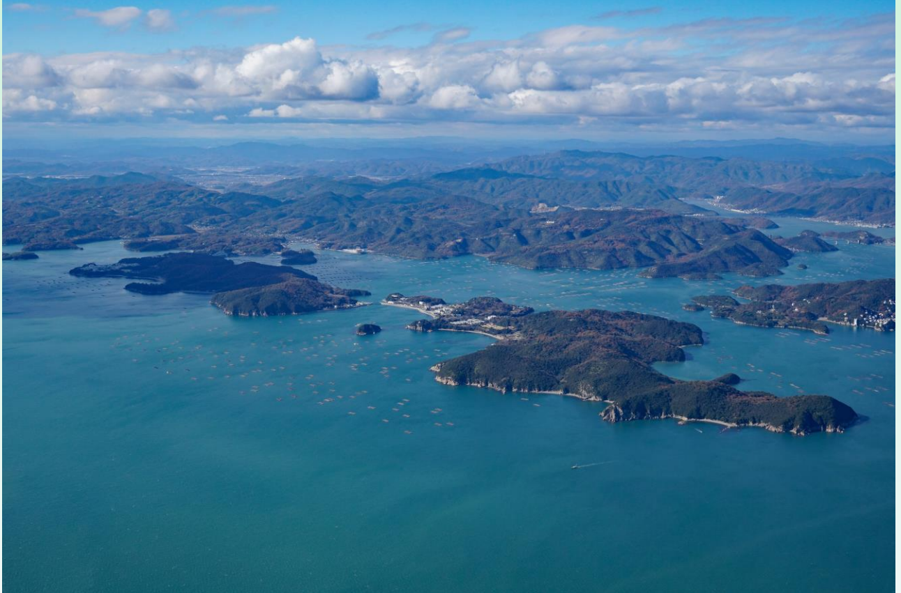
長島空撮