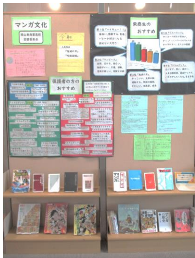
【第4期の展示の様子】

6 その他 令和6年2月5日（月）～2月9日（金）は、蔵書点検のため、臨時休館します。