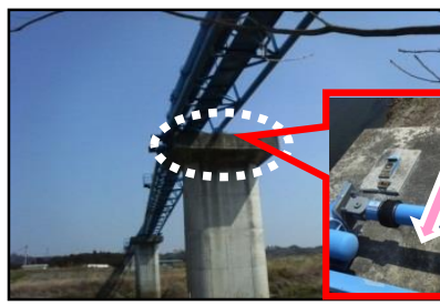
水管橋支承部の破断と横ずれ(宮城県)