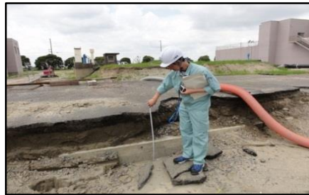
共同溝の不同沈下(茨城県)