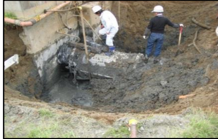
構造物接続部の配管離脱状況(茨城県)

★宮城、福島、茨城県などの臨海部に位置する工業用水道施設(場内・埋設管・水管橋)でも、揺れによる損傷、液状化、津波被害が発生した。