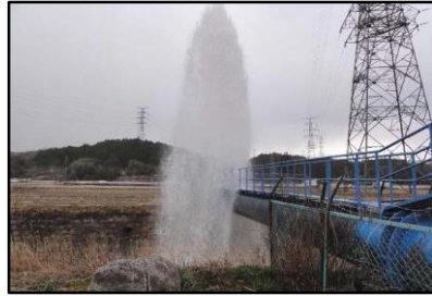
水管橋空気弁からの漏水(福島県)