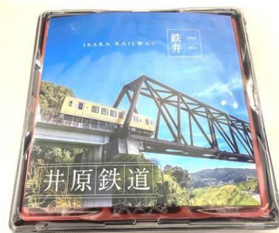
(弁当の上に掛紙を配置)