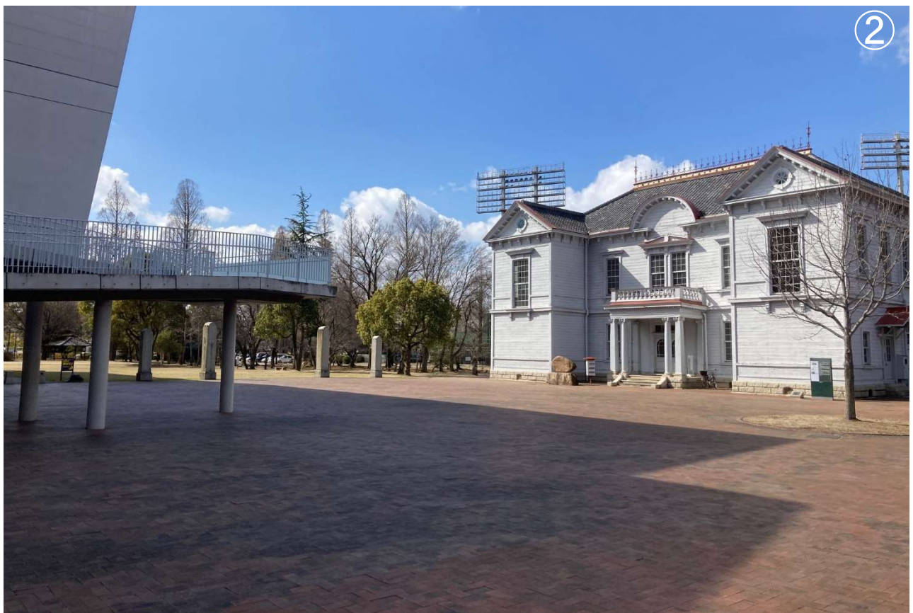
総合グラウンドクラブ前の広場