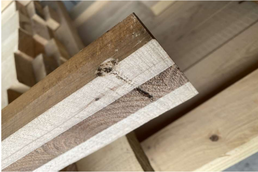
ビス穴跡状況（ビス穴を確認するためCLTをカットした状態）