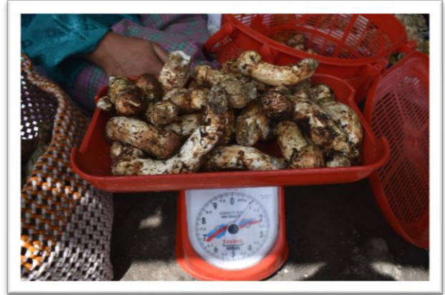
この量で 1 kg