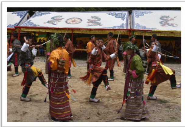
地元の学生による伝統舞踊