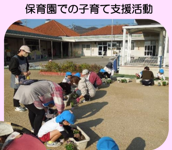
保育園での子育て支援活動