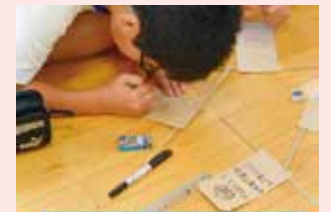
心をコメ(米)でメッセージを書きました