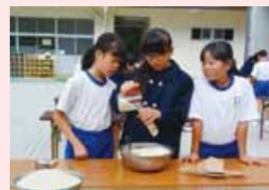
お米も子供達の思いも詰まっています!

県立新見高校北校地の生徒が栽培した「あきたこまち」を新見市立思誠小学校児童と一緒に収穫し、小学生が1合ずつ米袋に小分けして、特殊詐欺被害防止の啓発品を作りました。