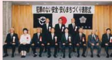
全国防犯有功者の皆さん