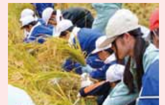
新見高校生と新見・思誠小学校児童が収穫中