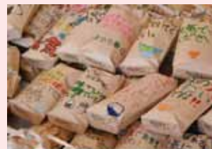
思いをコメ(米)で袋詰めしました