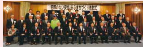
知事表彰の皆さん