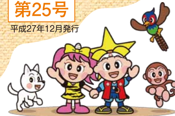
岡山県マスコット 「ももっち」「うらっち」と仲間たち