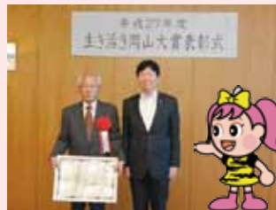
石井安全パトロール隊