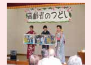
安全・安心まちづくり講師の講演風景