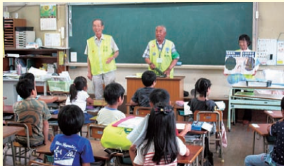
三敷小学校（岡山市）