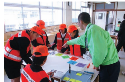
地域安全マップづくりの助言