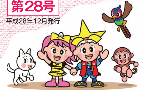
岡山県マスコット 「ももっち」「うらっち」と仲間たち