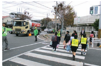
子ども見守りへの同行