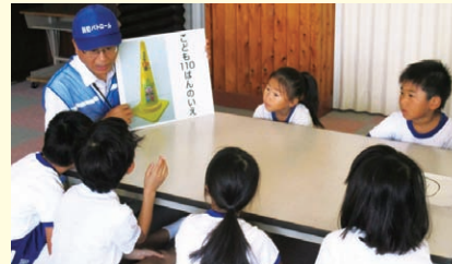
川面小学校（高梁市）