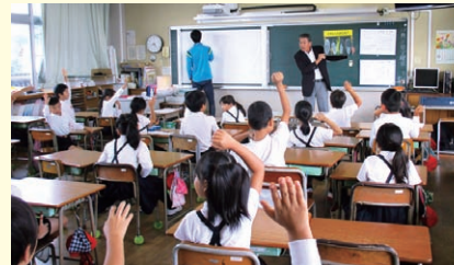
早島小学校（早島町）