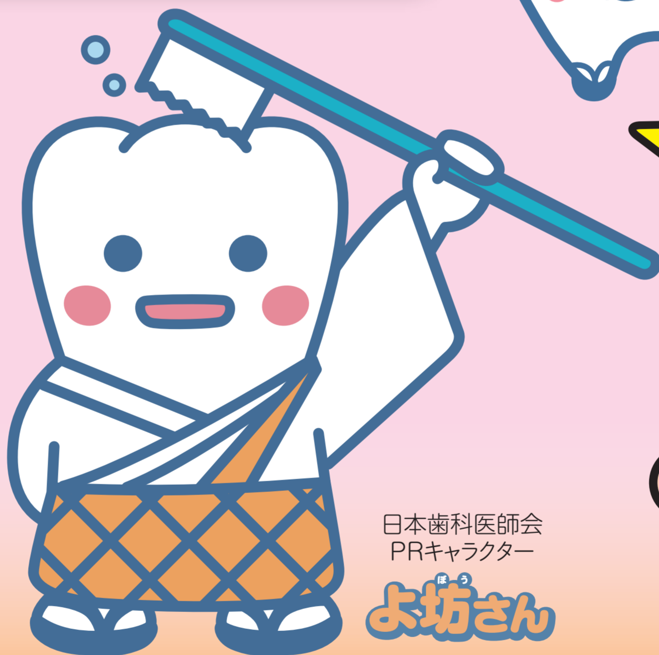
日本歯科医師会 PRキャラクター