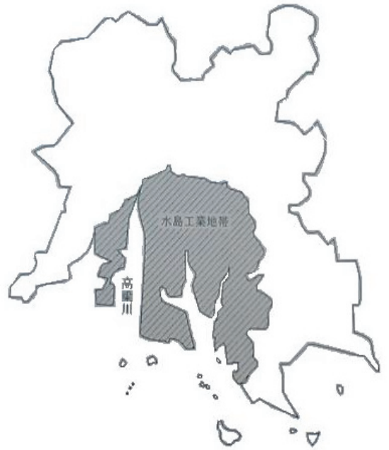
水島工業地帯の区域

水島海岸通1～5丁目、水島川崎通1丁目、水島中通1～4丁目、水島福崎町、水島西通1～2丁目、水島東千鳥町、水島西千鳥町、水島相生町、水島東常盤町、水島西常盤町、水島東栄町、水島西栄町、水島東弥生町、水島西弥生町、水島東寿町、水島西寿町、水島東川町、水島南緑町、水島北緑町、水島南瑞穂町、水島北瑞穂町、水島南春日町、水島北春日町、水島南幸町、水島北幸町、水島青葉町、水島高砂町、神田1～4丁目、水島明神町、水島南亀島町、水島北亀島町、福田町浦田、福田町福田、福田町古新田、北畝1～7丁目、中畝1～10丁目、福田町東塚、東塚1～7丁目、南畝1～7丁目、松江1～4丁目、潮通1～3丁目、福田町広江、広江1～8丁目、呼松町、呼松1～3丁目、連島町連島、連島町亀島新田、連島町西之浦、連島町鶴新田、連島町矢柄、鶴の浦1～3丁目、連島1～5丁目、連島中央1～5丁目、亀島1～2丁目、児島通生、児島塩生、児島宇野津、玉島乙島