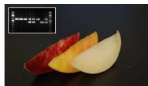
黄遺伝子マーカーによるモモ果肉色の選抜

モモやブドウを中心とした果樹の農業形質を決める遺伝子を解析し、望む特徴を兼ね備えた新品種を効率的に育成する技術の開発を行っています。