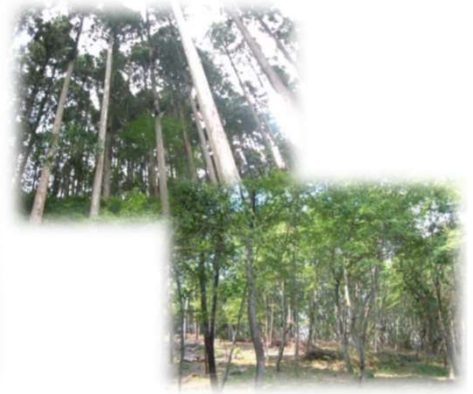
手入れが行き届いた森林