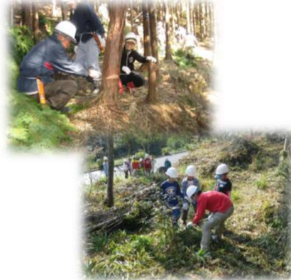
県・市町村・森林ボランティア 団体等による森林保全活動