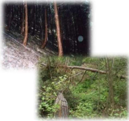
手入れが不足した森林

森林の重要性を県民の方々に普及啓発するとともに、県民各層が気軽に自主的かつ積極的に森林活動へ参加できるよう活動情報や場所の提供、技術指導など県民の社会貢献活動を支援することを目的としています。