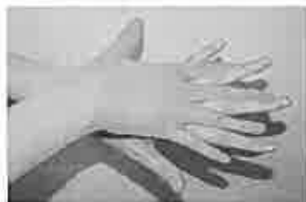
2. 手の甲を伸ばすように洗う