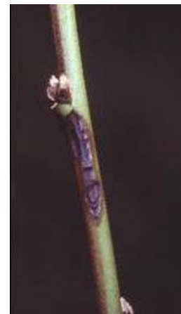
図2 夏型枝病斑(新梢)

農薬の使用に当たっては農薬使用基準を遵守するとともに、ドリフトに注意するなど、安全・適正に使用するようお願いします。 収穫後の農薬使用は、次作(令和6年作)での回数のカウントとなりますので御注意ください。