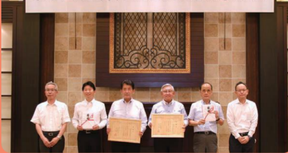
第74回全国植樹祭岡山県実行委員会第5回総会

全国植樹祭は、豊かな国土の基盤である森林・緑に対する国民の理解を深めるために、毎年春に開催されます。天皇后陛下下の御臨席を賜り、県内外から多くの参加者を迎えて、式典行事や記念植樹などが行われます。