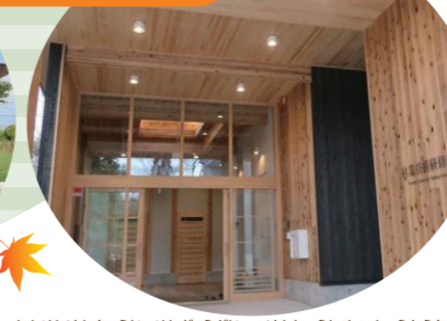
サイクリングセンター(真庭市)