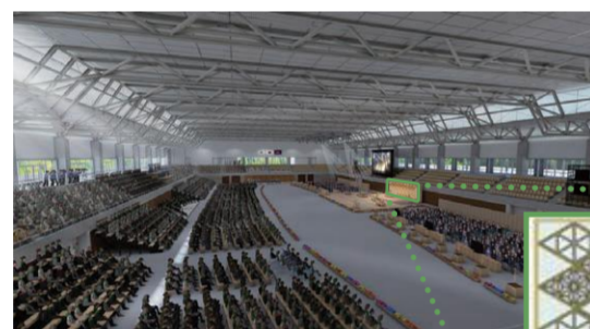
式典会場(イメージ図)

御座所背面... 県内を流れる三大河川を伝統木工技法の組子でデザイン CLTゲート... 丸太生産量が全国でもトップクラスの岡山県産ヒノキで制作したCLTでデザイン