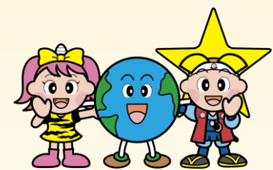
岡山県「ももち」と「うらっち」