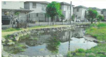
学校環境緑化(倉敷市 倉敷南小)