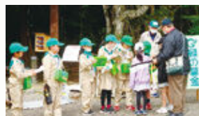
みどりの少年隊による募金活動