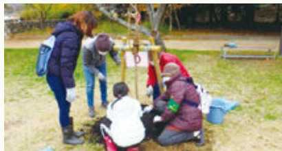
市民による公園の緑化(倉敷市酒津公園)