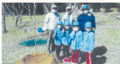
公園・学校など公共施設の緑化(備前市)