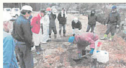
公園・学校など公共施設の緑化(美作市)