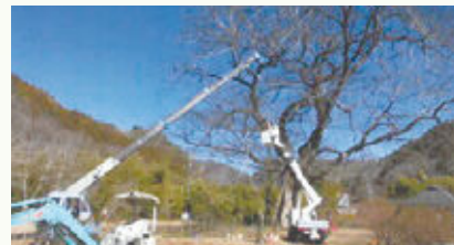
巨樹・老樹・名木の保存(美作市 横川のムクノキ)