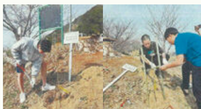
公園・学校など公共施設の緑化(笠岡市)