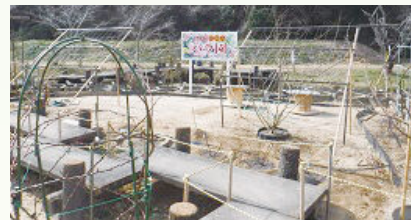
市民団体による公園整備(井原市)