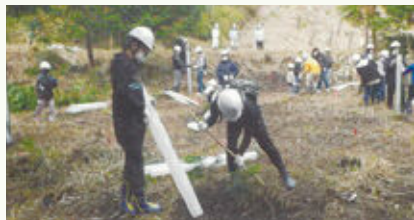
子供たちによる植樹(津山市 加茂小)