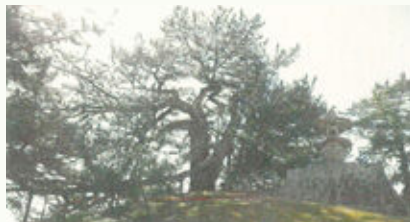
巨樹・老樹・名木の保存(総社市 角力取山の大神)