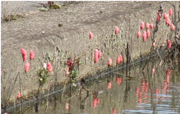
図1 用水路壁に産みつけられたジャンボタニシの卵塊 （7月の状況）