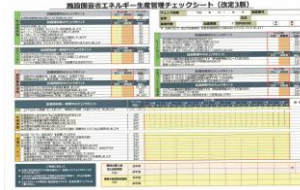
▲省エネチェックシート