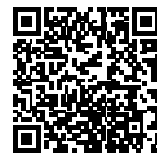
▲省エネ通知のページQRコード