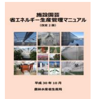
▲省エネマニュアル