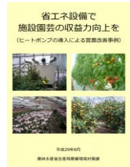
▲省エネで収益力向上を