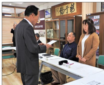
【第1回学校運営協議会】（令和6年5月22日）

第1回学校運営協議会では、教育長から委員さん一人一人に任命状の交付があり、その後、会長の進行で今年度の計画等について協議が行われました。