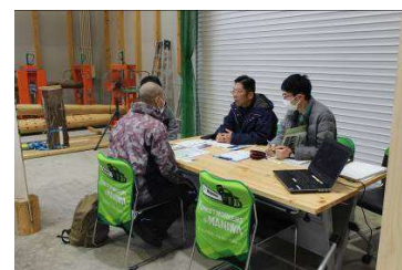
林業就業ガイダンスの開催