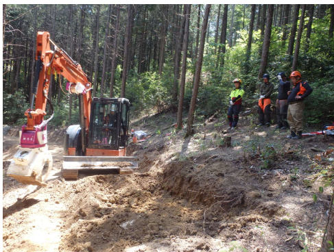
森林作業道作設オペレーターの育成