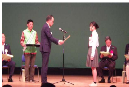
緑化運動ポスター等受賞者表彰