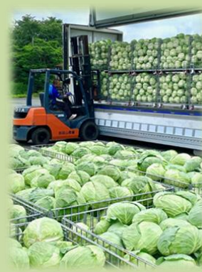
図2 鉄コンテナでの集荷作業