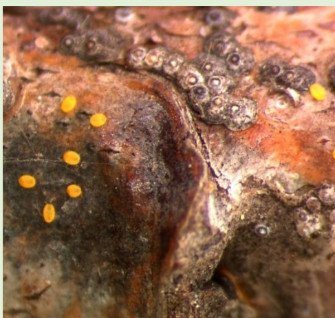
ナシマルカイガラムシ介殻と歩行幼虫