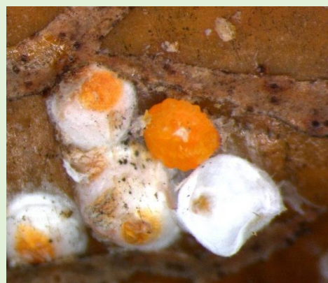
クワシロカイガラムシ介殻と雌成虫