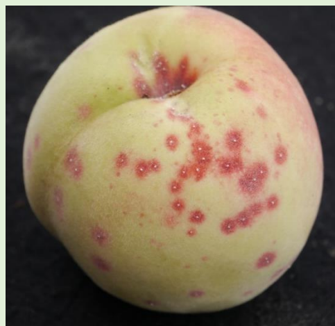
カイガラムシ類による果実被害