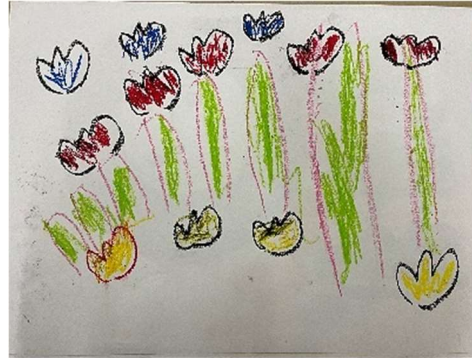
作品名：「チューリップ」