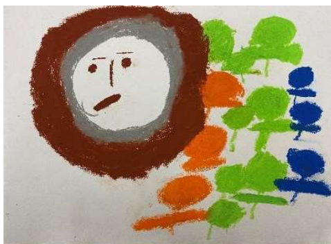
作品名：「お花畑と私」