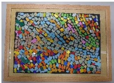
作品名：「うみのなみ」