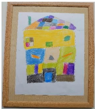
作品名：「ポツンと一軒家」