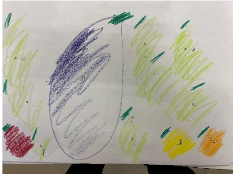
作品名：「なすびと果物」