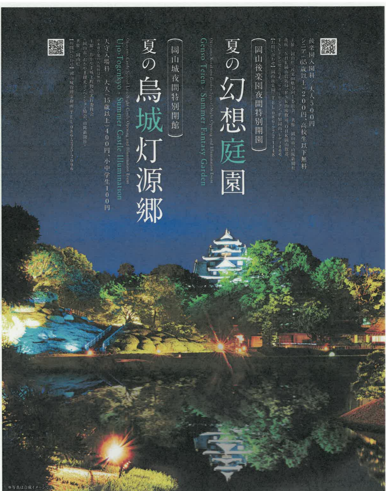
※写真は合成イメージです。