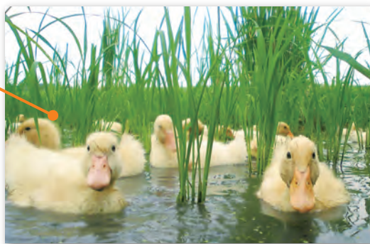
アヒル農法の水田