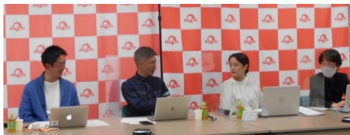
和気あいあいとした現場の様子です