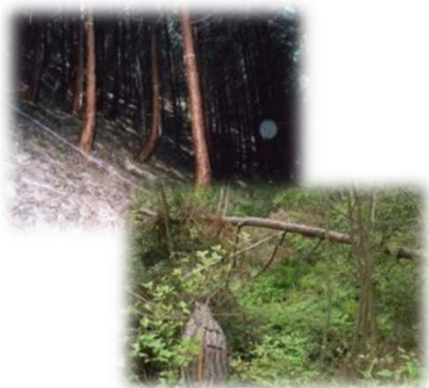
手入れが不足した森林

森林の重要性を県民の方々に普及啓発するとともに、県民各層が気軽に自主的かつ積極的に森林活動へ参加できるよう活動情報や場所の提供、技術指導など県民の社会貢献活動を支援することを目的としています。