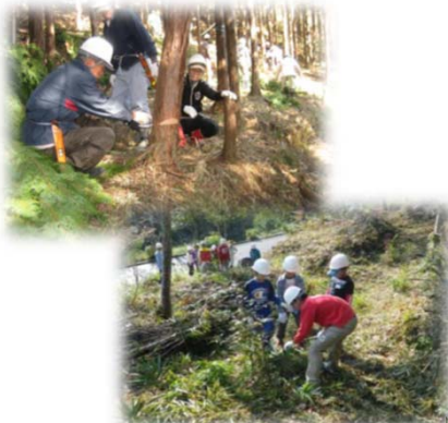
県・市町村・森林ボランティア団体等による森林保全活動