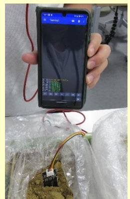
土壌水分計 (イメージ)