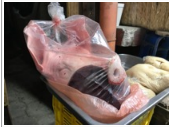
豚の顔（グアテマラの伝統的なスープに使う）