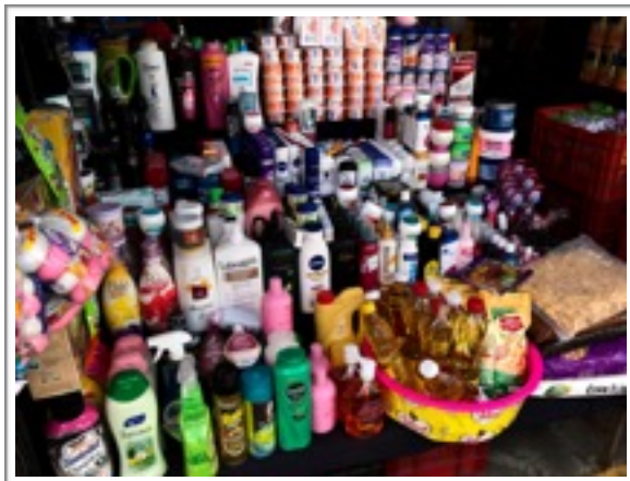
日用品（シャンプーや洗剤など）