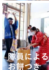
隊員による お餅つき