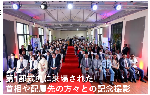
第1部式典に来場された首相や配属先の方々と の記念撮影

首相からはボランティア派遣を拡大してほしいと、協力隊事業に前向きな声をいただきました。協力してくれる現地のマダガスカル人と一緒に、自分のできることを地道に実践し、協力隊の活動を更に広めていきたいと感じました。