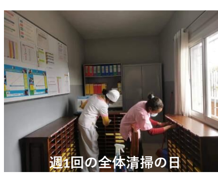
週1回の全体清掃の日