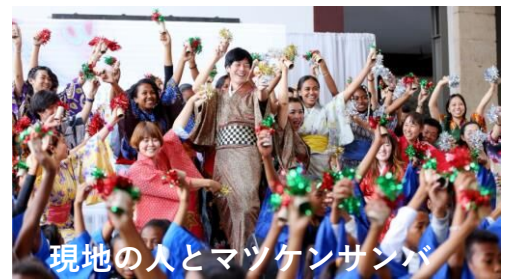
現地の人とマツケンサンバ

また空手を習っているマダガスカル人による 空手パフォーマンス や、 お餅つきパフォーマンス で日本の文化を直接感じてもらうことができました。