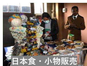
日本食・小物販売