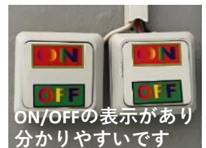
ON/OFFの表示があり 分かりやすいです