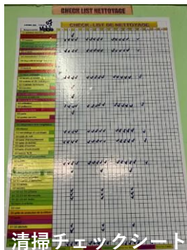
清掃チェックシート