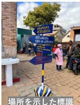
場所を示した標識