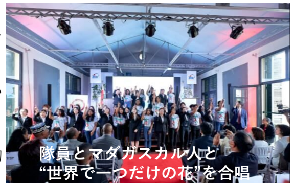
隊員とマダガスカル人と “世界で一つだけの花”を合唱