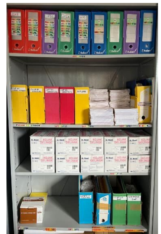
整理・整頓された棚

スタッフは、「5Sを取り入れるようになってからは、物品を整理・整頓をする癖がついた」「探し物が早く見つかるようになって無駄な時間がなくなった」と話しており、5Sの必要性を実感しているようです。