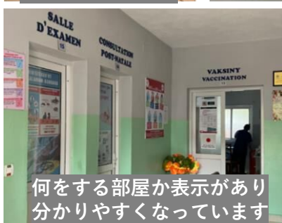
何をやる部屋か表示があり 分かりやすくなっています