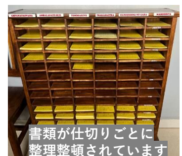
書類が仕切りごとに 整理整頓されています