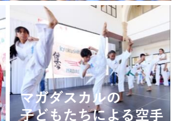
マダガスカルの子 どもたちによる空手