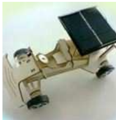
ミニ・ソーラーカー