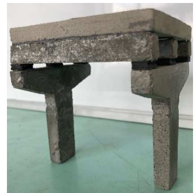
セメントによる模型