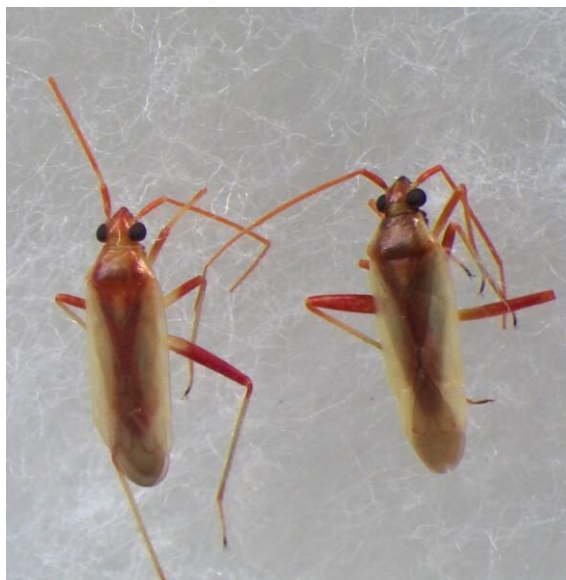
アカスジカスミカメ成虫（体長約 5 mm）