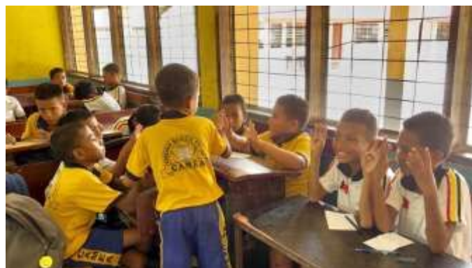
8×6を計算するために、8のかたまりを6つ作っている。(4年生)