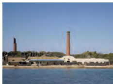
アート: 柳幸典 建築: 三分一博志