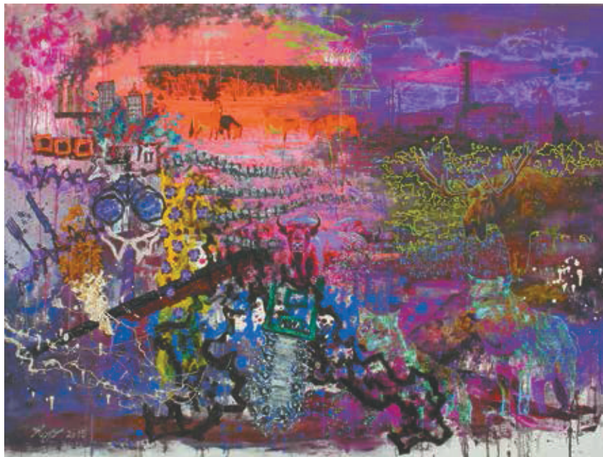
〈動物の楽園チュルノブイリ〉 2015