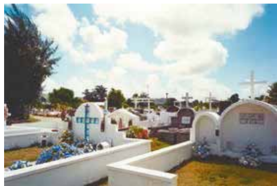
《torii》 2006-2012 Saipan, USA