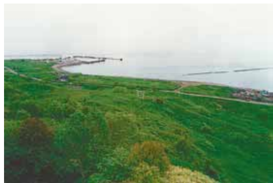
《torii》 2006-2012 Sakhalinskaja, Russia

JR岡山駅東口から 徒歩：約15分 路面電車：東山行「城下」下車 徒歩3分 宇野バス：四御神/瀬戸駅/片上方面行「表町入口」下車 徒歩3分 岡電バス：藤原団地行「天神町」下車すぐ 循環バスめぐりん：岡山駅前(ドレミの街前)バス停10番乗り場、 県庁・京橋線(Cルート)「表町入口」下車 徒歩3分