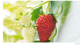
いちごファーム事業