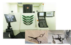
医療プロジェクト