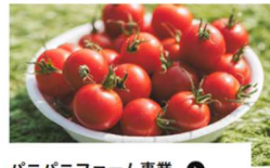
パニファーム事業