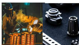
ロストワックス・MIM本事業