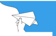
紙ヒーローキ事業