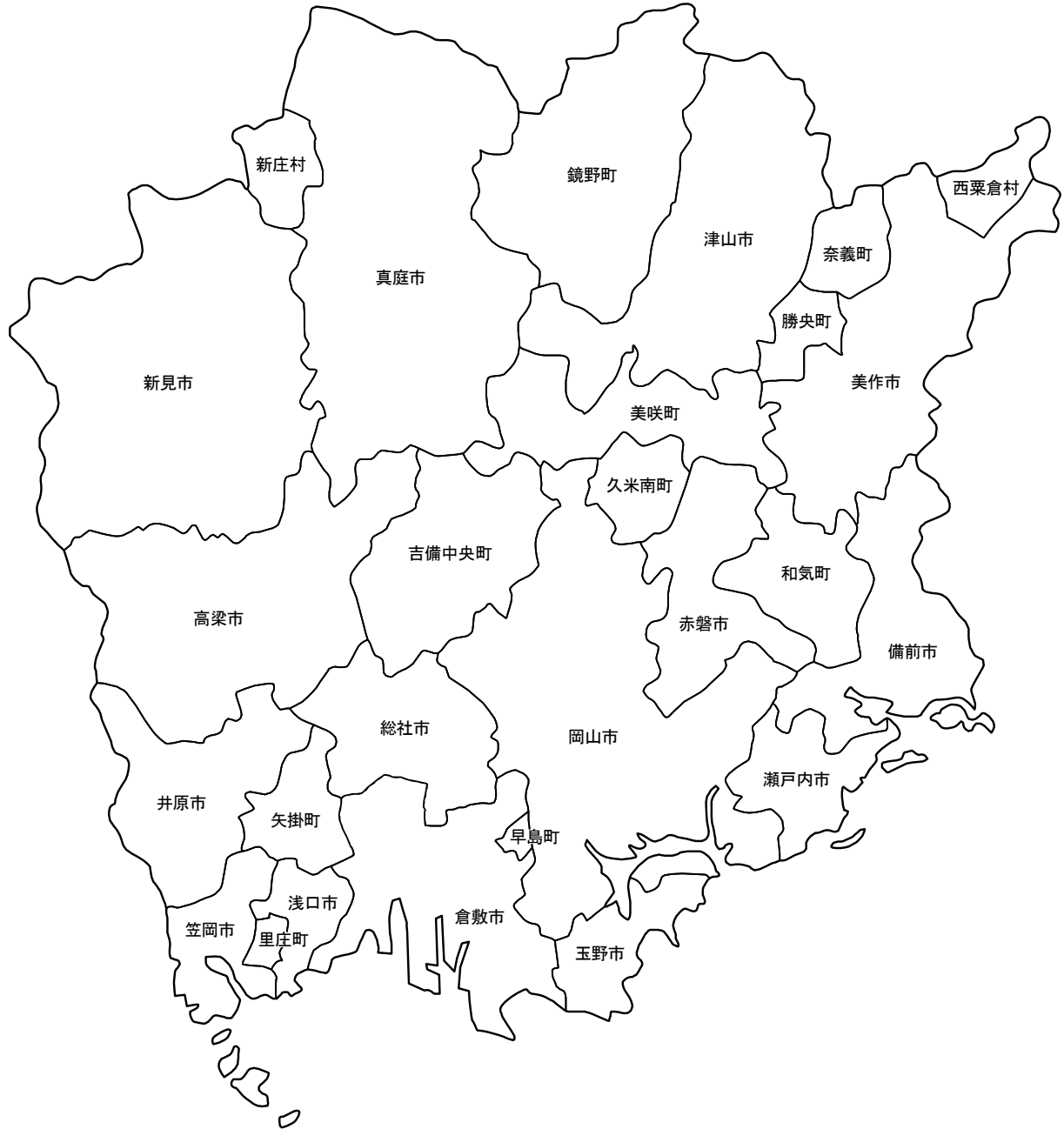
人口と世帯数