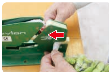
余分か所をカット