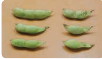
A品:すべての粒が肥大