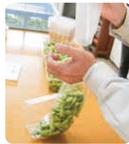
空気を抜きながら袋上部を回転