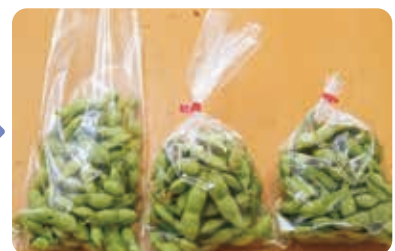
袋の変化(右が完成品)