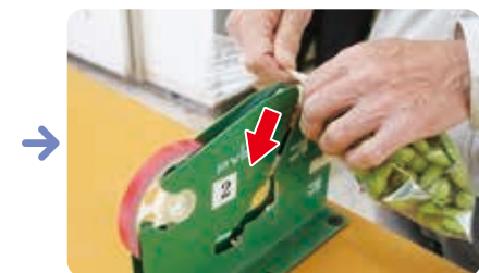
結束テープでしぼる