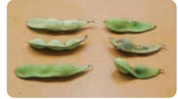
B品:肥大の不ぞろい、変色したさやを含む