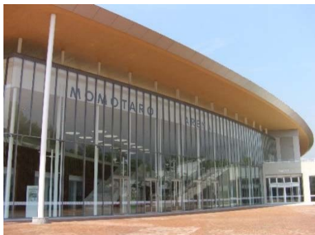
体育館 【桃太郎アリーナ】 (平成17年竣工)