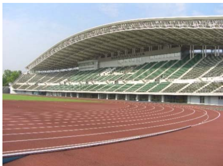
陸上競技場 【シティライトスタジアム】 (平成15年竣工)

岡山県総合グラウンド及び倉敷スポーツ公園の多くの施設が完成から10年以上経過し、公園施設の老朽化が進行しています。