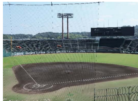
野球場 【マスカットスタジアム】 (平成7年竣工)