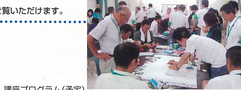
講座プログラム(予定)