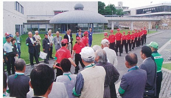
講座プログラム(予定)