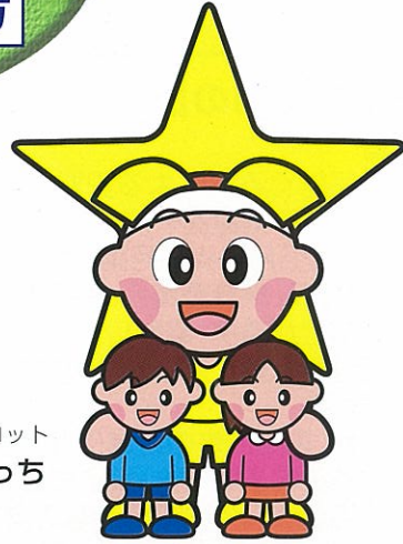
岡山県マスコット ももっち