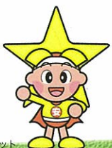
岡山県マスコット ももっち