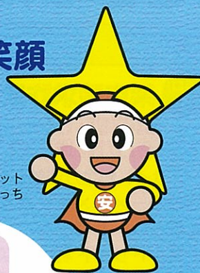
岡山県マスコット ももっち