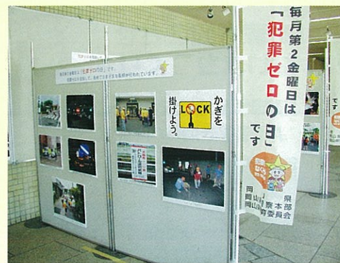
(岡山市役所でのパネル展)

現在、県内各地で行われている自主パトロール隊等の活動を広く県民の皆さんに紹介し、より一層の活動への理解と運動の推進を図るため、県の広報紙や展示用パネル等に使用させていただける活動中の写真を募集します。なお、応募の際、被写体の人物の肖像権・プライバシーに関する事項等の確認が必要となる場合があります。