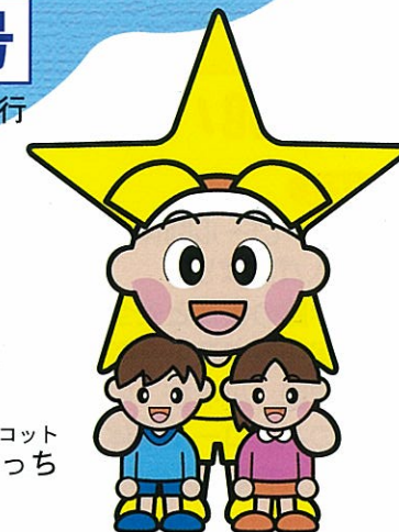
岡山県マスコット ももっち