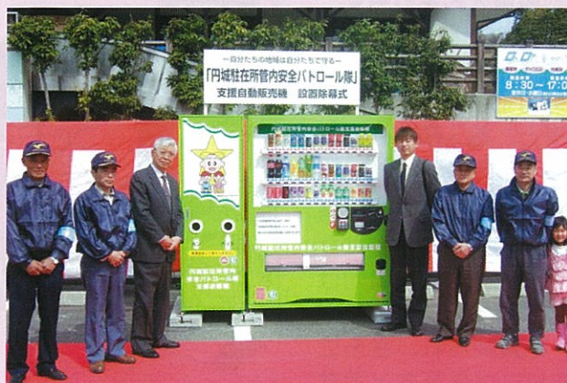
円城駐在所管内パトロール隊支援自動販売機設置除幕式 (平成21年3月28日：道の駅かもがわ円城)

鮮やかなグリーンカラーリングと大きなロゴの青パト隊の名前、安全・安心ももっちが印象的な外観に仕上がっており、その売上金の一部が青パト隊に寄付される仕組みとなっています。