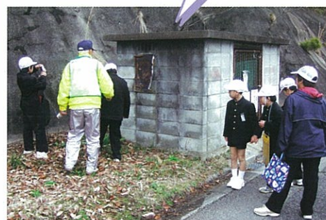
備前市立伊里小学校の取組(総合的な学習の時間)

グループごとに、「入りやすい場所」や「見えにくい場所」を見つけます。子ども110番の家などの安全な場所もチェックします。