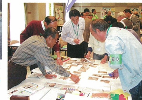
地域安全マップ指導者養成講座(高梁市総合文化会館)