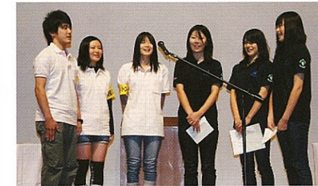
学生ボランティア代表による開会宣言

自主パトロールや子ども見守り活動等の実践者、市町村・学校・警察関係者、安全・安心岡山県づくり県民会議会員な ど約400人の方々に参加いただき、安全・安心まちづくりに功労のある個人・団体の表彰や、県民運動として取り組む重 点活動等を内容とする行動計画の採択が行われました。(受賞された皆様は裏面)