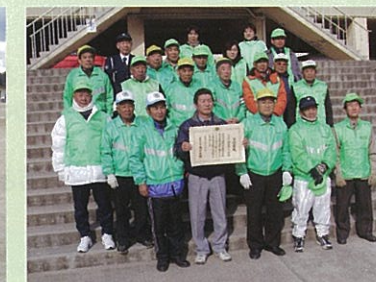
平成22年12月16日 県教育庁藤井保健体育課長から伝達されました。