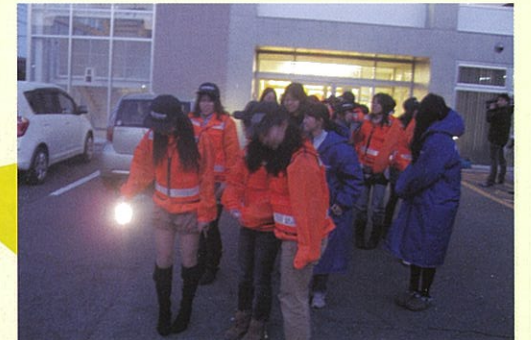
そろいのユニフォームでのパトロール