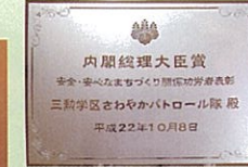
平成22年10月8日 総理大臣官邸にて、 国家公安委員長から 伝達されました。