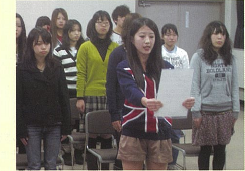
代表による決意表明

平成22年12月16日(木)、県内の大学生で組織された防犯ボランティア団体「ももパト隊」に対し、帽子、ベスト、ジャンパーなどが貸与され、そろいのユニフォームでの防犯パトロールなど、本格的な活動が開始されました。