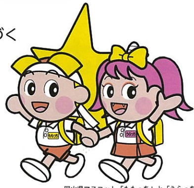
岡山県マスコット「ももち」と「うらっち」