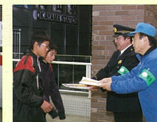
自転車盗難防止にはツーロック ひったくり防止には防犯ネット