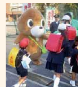
あいさつ運動の様子

また、1時間目には、日頃お世話になっている見守り隊の方への感謝の会や、笠岡警察署員の指導による防犯教室を行いました。子どもたちは、DVDを見たり、ロールプレイを体験したりして、不審者に声を掛けられた時の対処方法などを学習しました。