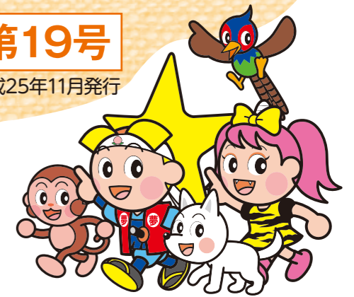
岡山県マスコット 「ももち」と「うらっち」