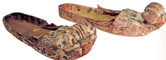
一級文物《唐花文錦鞋》 唐・8世紀/ 1968年新疆ウイグル自治区トルファン・アスターナ古墓381号墓出土/ 新疆ウイグル自治区博物館