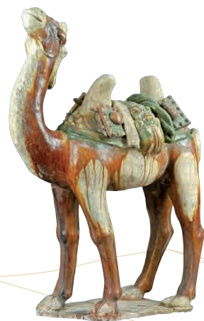
《駱駝》 唐・8世紀/ 1972年河南省洛陽市瀾池區谷水出土/ 洛陽博物館

休館日: 9月30日(月)、10月7日(月)・15日(火)・21日(月)・28日(月)、11月5日(火)