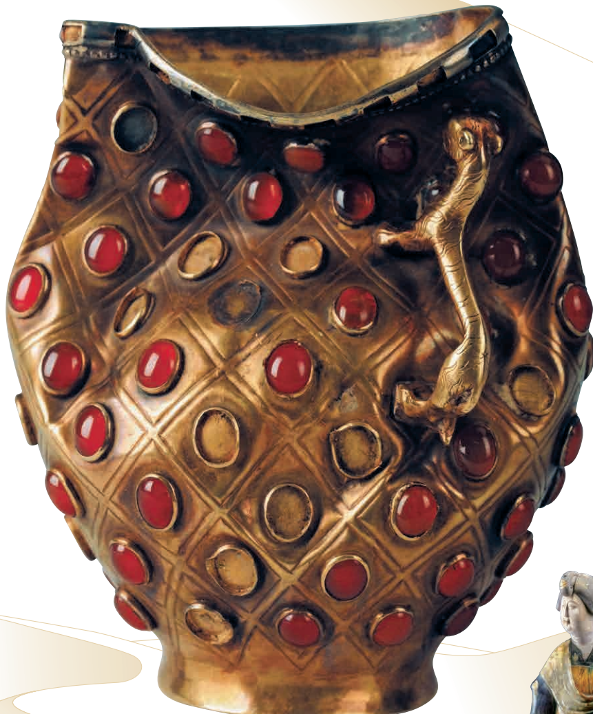
一級文物《瑪瑙象嵌杯》 5～7世紀/ 1997年新疆ウイグル自治区イリ州昭蘇県ボマ古墓出土/ イリ州博物館