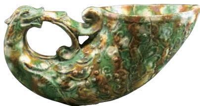
一級文物《鳳首杯》 唐・8世紀/1982年陝西省西安市韓森寨出土/陝西歴史博物館

【当日一般】1,600円 ▶ 1,500円 ※本チラシに掲載の各品目について、本館にて開館10分前まで予約。 ※予約の無い場合は開館10分前まで予約。