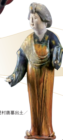
一級文物《女子俑》 唐・8世紀/ 1959年陝西省西安市中堡村唐墓出土/ 陝西歴史博物館